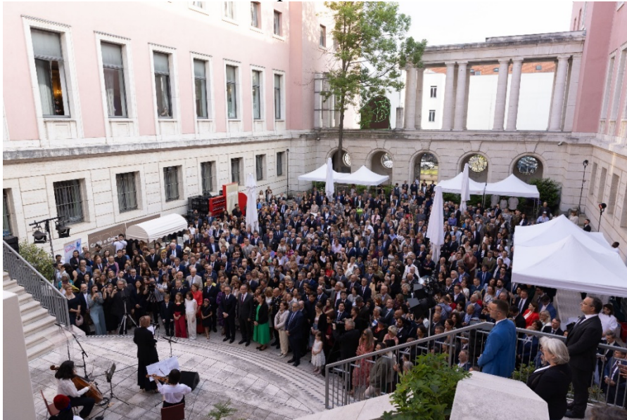
Festa della Repubblica edizione 2025

Ogni anno l'Ambasciata organizza un ricevimento per celebrare il 2 giugno alla presenza di ospiti istituzionali, del mondo politico e culturale tedesco.